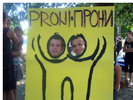
Fotografija sa PRONI festivala

PRONI se već duže vrijeme bavi razvojem omladinske politike za Brčko district u saradnji sa drugim omladinskim organizacijama, te razvojem i promocijom omladinske politike u Bijeljini.