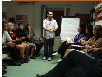
Fotografija sa prezentacije

Shodno tome, može se, uskoro, očekivati organizacija novog treninga za njih.